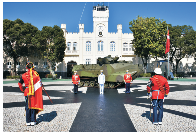
Ato foi presidido pelo Comandante da Marinha