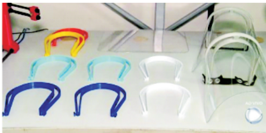
Máscaras faciais produzidas no CRESUMAR

O CTecCFN (CRESUMAR) utiliza impressoras 3D na produção de máscaras para profissionais da Saúde, atuando na fabricação de máscaras face shield, que garantem a cobertura completa do rosto, a partir de impressoras 3D, com uma produção diária de cerca de 30 máscaras por dia, que foram doadas aos profissionais da saúde engajados no combate à pandemia. Com o apoio do Centro de Intendência da Marinha em Parada de Lucas (CeIMPL), além da produção de Equipamentos de Proteção Individual (EPI) e máscaras cirúrgicas, também estão sendo produzidos novos dispositivos para auxiliar na prevenção à pandemia, tais como: dispositivo de intubação endotraqueal, caixa de acrílico, projetada para cobrir a cabeça do paciente e proteger o profissional da saúde durante o procedimento nas vias aéreas do paciente; e kits hospitalares, fabricados em aço carbono, compostos por cama, biombo, suporte para soro e escada. Para dar conta da demanda crescente destes equipamentos, o Centro necessitou passar por adaptações e transformar instalações em verdadeiras linhas de produção, utilizando a capacidade plena de seus militares, que estão trabalhando 24 horas por dia, durante os sete dias da semana, em esquema de rodízio.