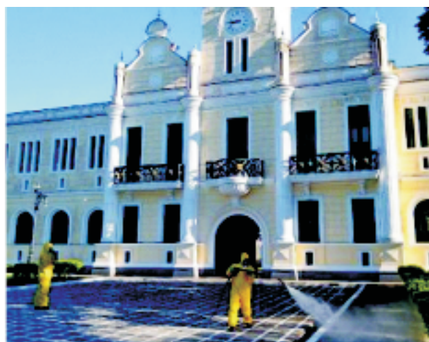
Colégio Naval 17 e 18JUN