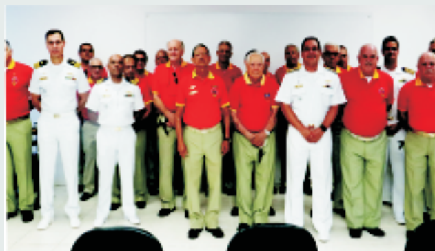
Diretoria da SR Florianópolis e autoridades presentes na Sessão Solene