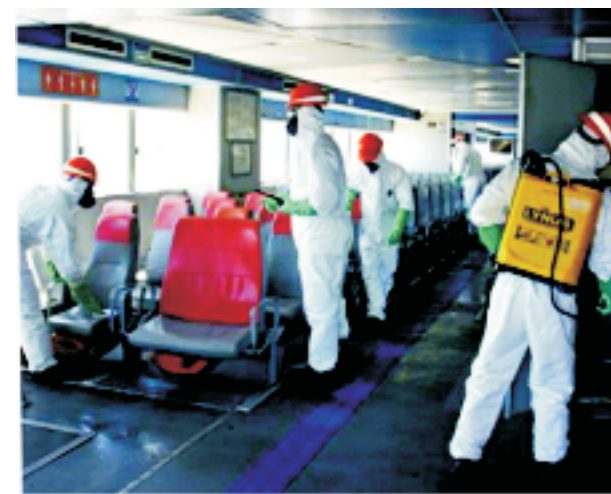
Barcas Rio-Niterói - 26 MAR