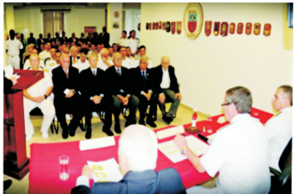
Posse da Nova Diretoria Administrativa 2019-2021