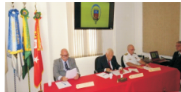
Componentes da Mesa da AGO