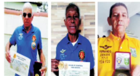
Veteranos são agraciados na brigada de infantaria Paraquedista.