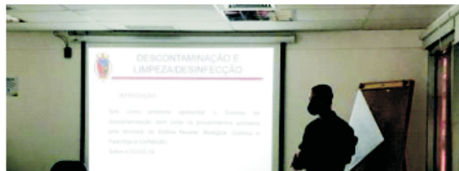
Aeroporto Internacional Galeão / Tom Jobim, no Rio de Janeiro – 24ABR

Em apoio à prevenção e pensando em contribuir com a proteção de profissionais de diversas áreas que por atuarem em atividades consideradas essenciais e por conta disso foram expostos à contaminação diuturnamente, o GptOpFNDefNBQR constituído na área do 1º DN e as Equipes DefNBQR distritais realizaram mini cursos para capacitar profissionais de diversas áreas e instituições, ao longo dos meses de março a junho de 2020, por meio de instruções teóricas e práticas de ações de Defesa Nuclear, Biológica, Química e Radiológica (NBQR), na prevenção e no combate à pandemia, abordando temas como Equipamentos de Proteção Individual (EPI), aspectos básicos de defesa biológica, cuidados de saúde e primeiros socorros, além de como proceder em uma ação de descontaminação.