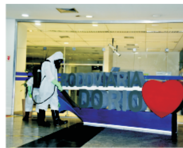
Rodoviária Novo Rio - 23 ABR