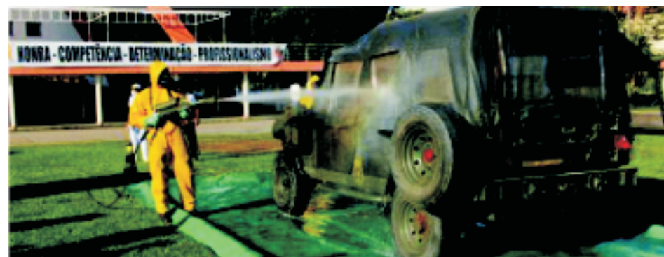
CIASC – capacitação de 120 civis de diversas áreas – 28ABR