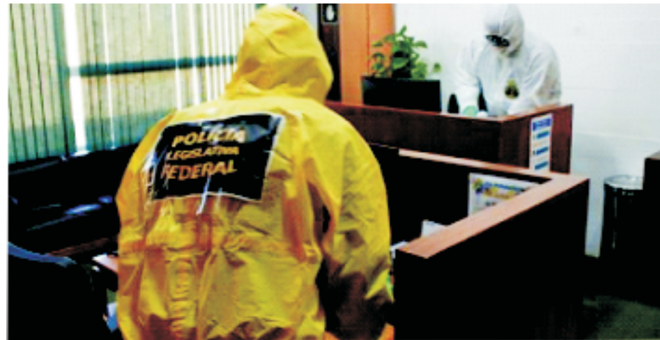
Câmara dos Deputados – Congresso Nacional

A operação contou com a presença de 49 militares da Marinha do Brasil e sete policiais legislativos, que realizaram o Estágio Básico de Capacitação em Defesa NBQR no Grupamento de Fuzileiros Navais de Brasília.