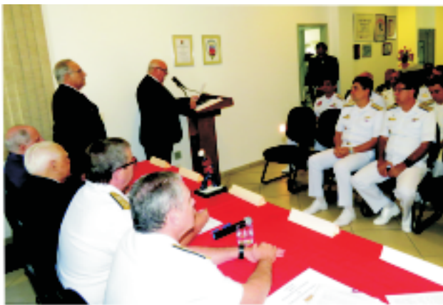
Palavras do Presidente Nacional