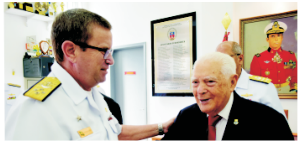
ComGerCFN e Almirante Fernando do Nascimento