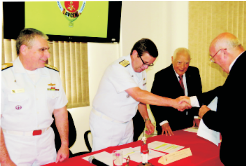
Assinatura de Acordo de Cooperação