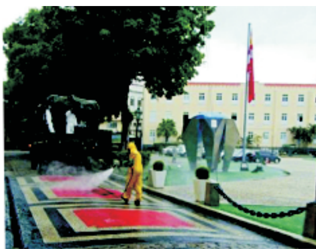
FSJ – 07JUN