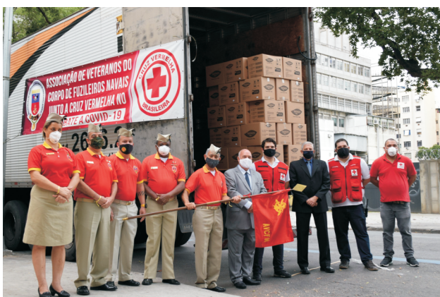
Parceria AVCFN e Cruz Vermelha