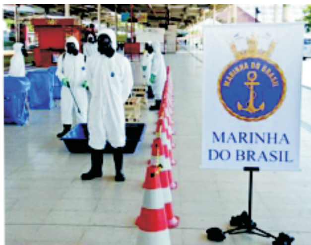
Terminal Alvorada BRT - 28 MAR