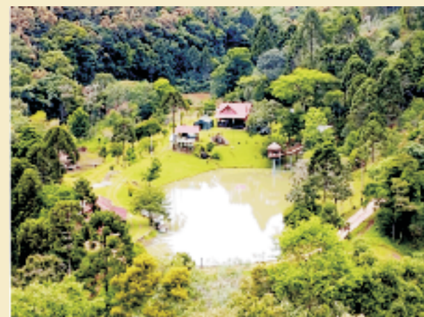
Vista aérea da área do acampamento