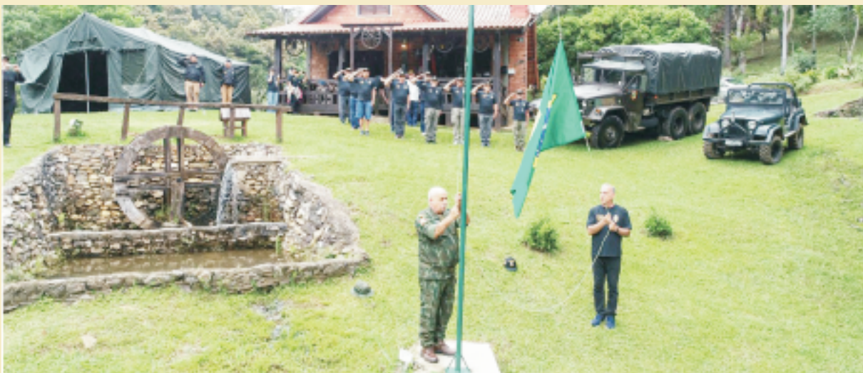
Cerimonial à Bandeira