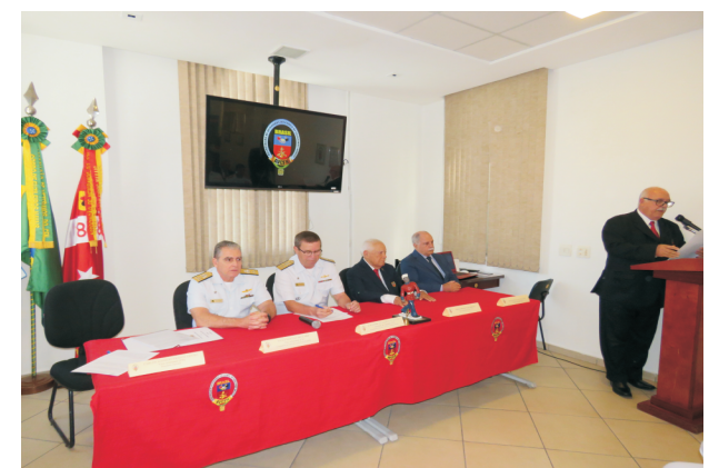
Palavras do Presidente Nacional