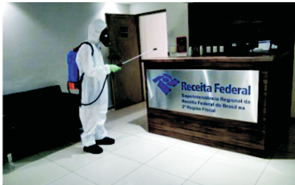
Superintendência da Receita Federal em Belém.

4º Distrito Naval – A Equipe de Resposta Nuclear, Biológica, Química e Radiológica do Comando do 4º Distrito Naval, nucleada no 2º Batalhão de Operações Ribeirinhas, realizou, no dia 17JUN2020, a desinfecção da Superintendência da Receita Federal em Belém.