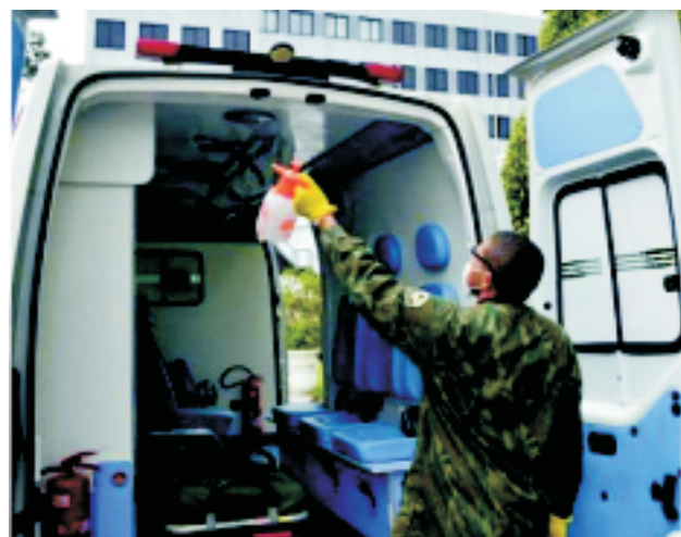
Escola Naval - 31 MAR a 02 ABR