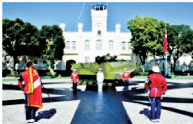
Ato foi presidido pelo Comandante da Marinha

Participaram ainda do ato os Comandantes da Força de Fuzileiros da Esquadra, do Pessoal de Fuzileiros Navais, do Material de Fuzileiros Navais e o Secretário da Comissão de Promoção de Oficiais.